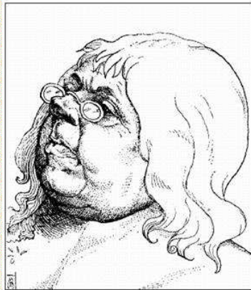
Abb. 9: Meister Weltklug

Hallo, wohin, mein Freund, mit dieser schweren Last?