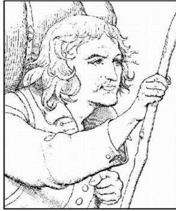
Abb. 5: Christ