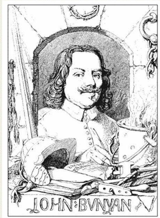
Abb. 1: John Bunyan