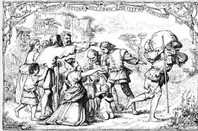
Abb. 4: Fliehender

„Ja“, erwiderte Christ, denn das war sein Name, „weil das alles, was ihr verlassen werdet, nicht würdig ist, mit dem Geringsten verglichen zu werden, was mir in Aussicht steht; Wenn ihr weiter mit mir gehen wollt und bleibt dabei, sollt ihr all dessen in gleicher Weise auch teilhaftig werden; denn wo Ich hingehet, ist genug und keine Entbehrung. Geht los und prüft meine Worte.“