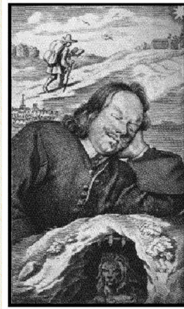
Abb. 2: Träumender John Bunyan im Gefängnis