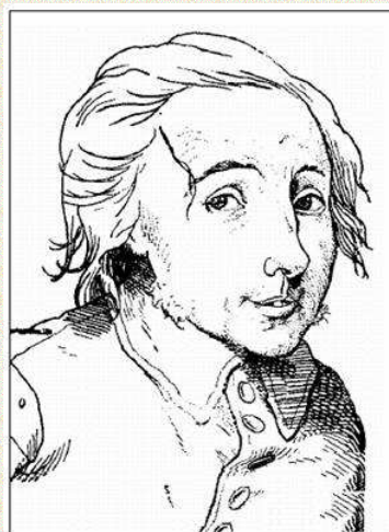
Abb. 7: Willig

Komm, Nachbar Christ, da wir nun beide hier ganz allein sind, so erzähle mir doch, während wir weitergehen, welche Dinge es sind, die uns erfreuen werden.