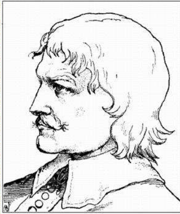
Abb. 8: Hilfe